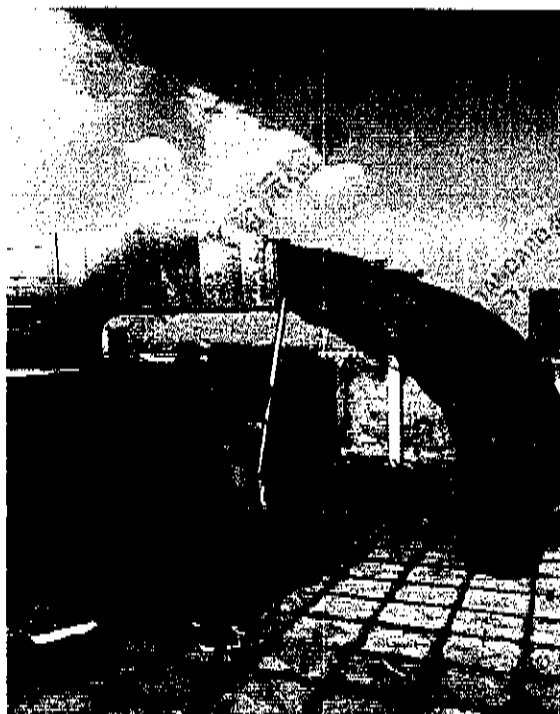
图 1 烘干工序废气排放口采样