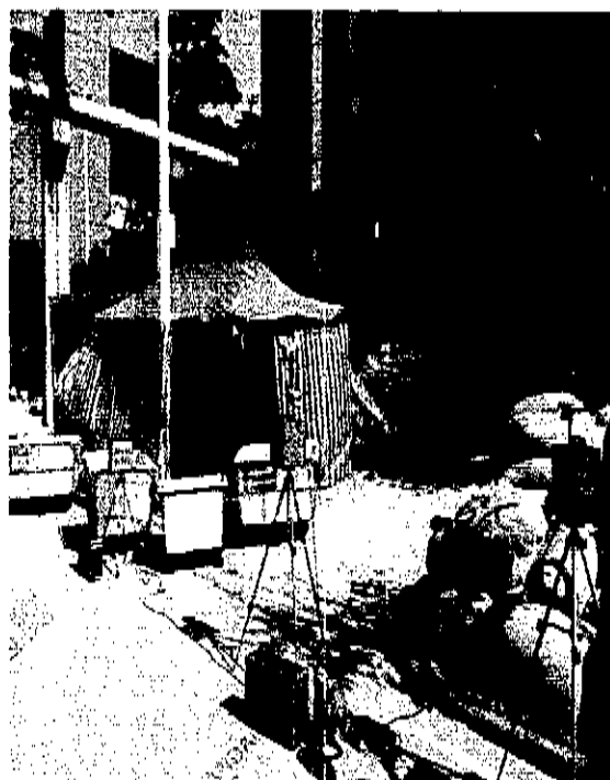
图 2 烘干工序废气无组织采样