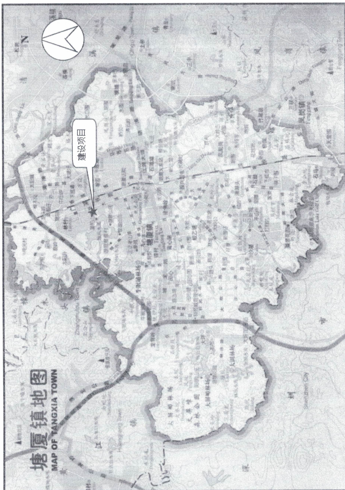
图 3.1-1 项目地理位置