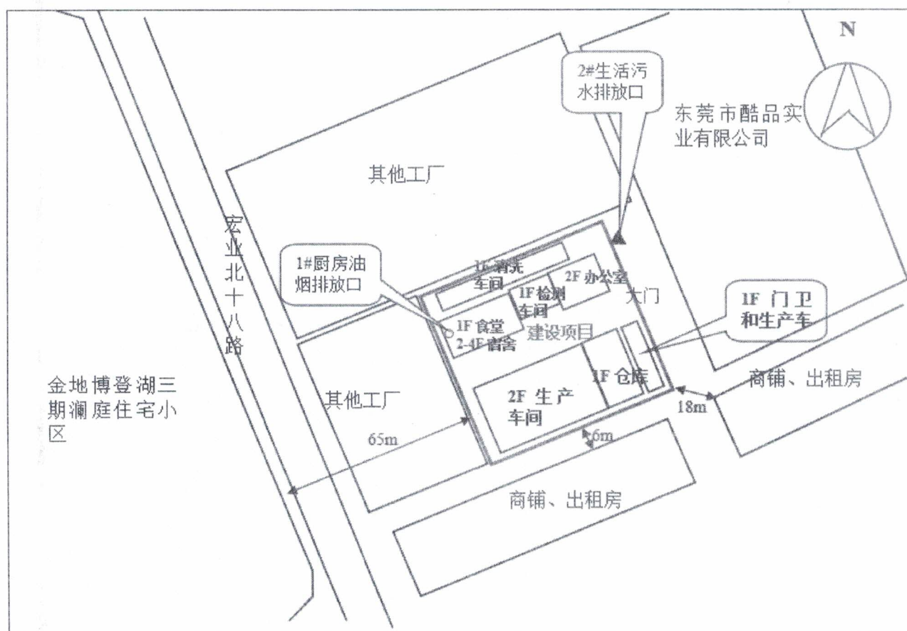
附图 3.1-2 项目平面布置示意图