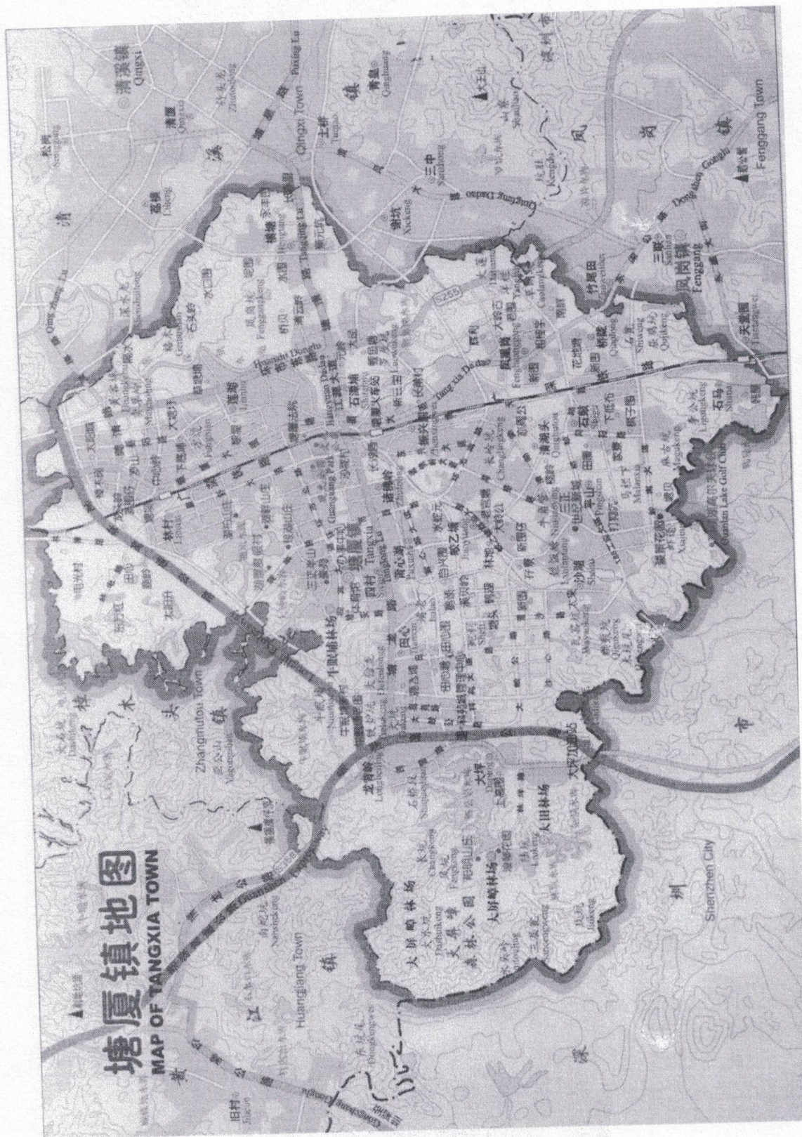
图 3.1-1 项目地理位置